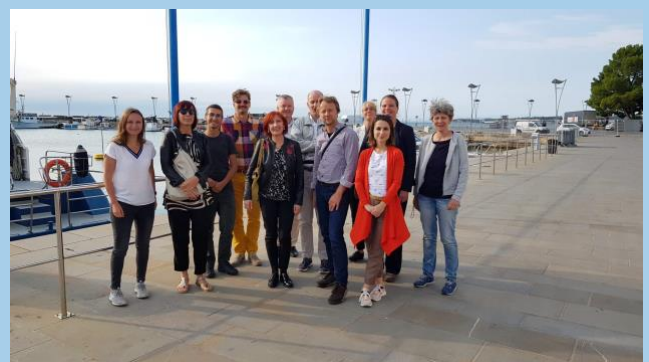
Figura 5 Koper, Slovenia, Kickoff Meeting