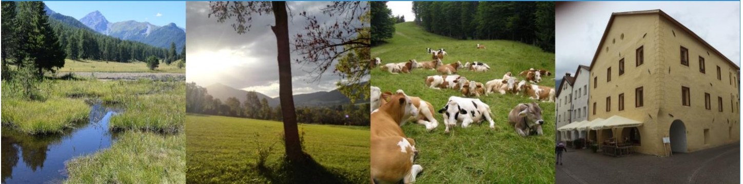
Figura 1 Aree pilota: Tarasp Lai Nair - Svizzera, Bassa Austria, Pohorje - Slovenia, Glurns - Sud Tirolo

UN USO INTELLIGENTE DEL TERRITORIO PER COMUNI SOSTENIBILI