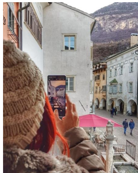
Figura 6 Neumarkt, Italia, di Mojca Hribernik

A partire dal 2° meeting dei partner tenutosi a Bolzano nel febbraio 2020, tutti i partner avevano già iniziato ad implementare i casi pilota attraverso seminari organizzati per ciascuna area pilota. Il giorno successivo i partner sono stati ospiti del sindaco di Egna/Neumarkt che li ha introdotti all'iniziativa dell'albergo diffuso, iniziata a marzo 2019, che ha lo scopo di far diminuire il numero degli appartamenti vuoti nel centro storico del paese.