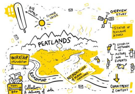
Figura 8 Cartoline Impuls4Action

* PER DESCRIZIONE, OBIETTIVI ED ALTRE INFORMAZIONI SUL PROGETTO E PER PARTECIPARE AL WEBINAR, SI PREGA DI VISITARE IL SITO UFFICIALE DELLA MACROREGIONE ALPINA EUSALP ED I SITI WEB DEL PARTNER *