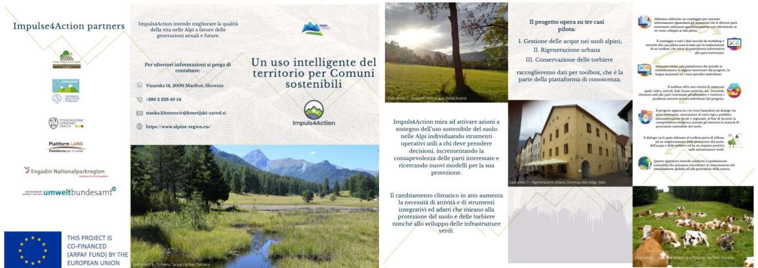
Figura 2 Brochure Impuls4Action