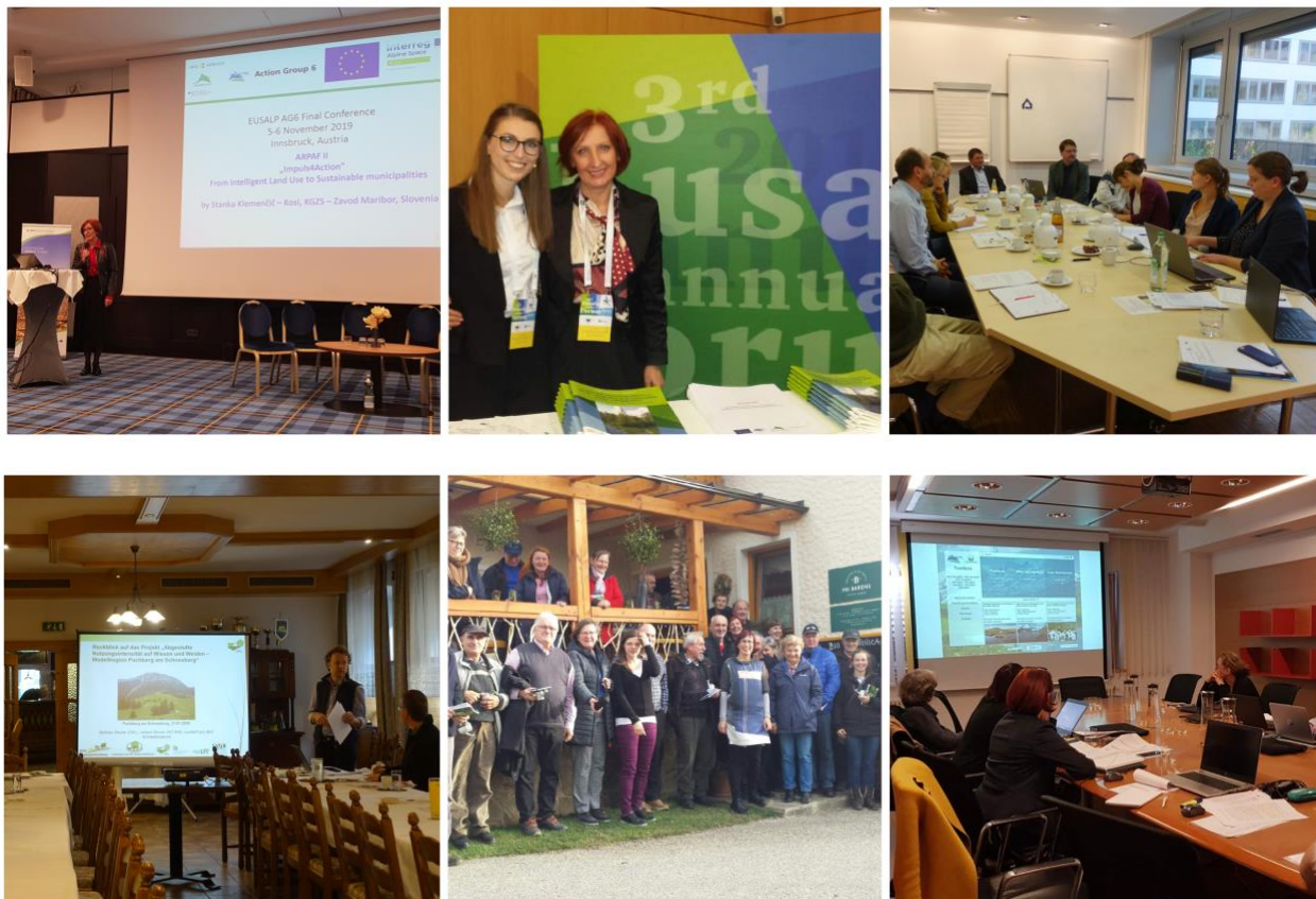
Figura 7 Presentazione sulla conferenza EUSALP AG6, 3° forum annuale ESALP, seminari, riunione dei partner