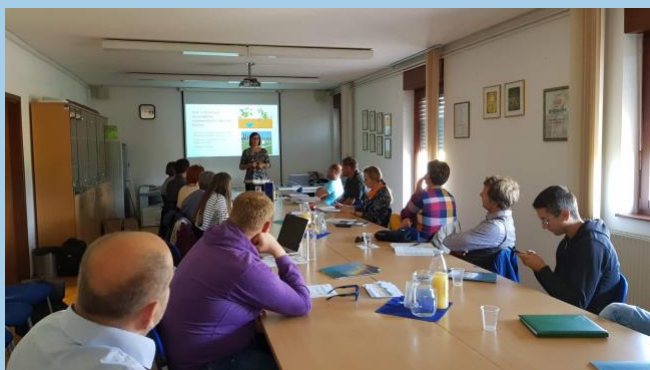
Figura 4 Centro di frutticoltura Bilje, Slovenia, 1° Seminario Gestione delle risorse idriche

partner e altre parti interessate hanno avuto l'opportunità di conoscere il caso pilota della Slovenia e come dovrebbe funzionare l'efficace gestione delle risorse idriche in agricoltura.