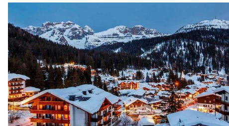
Madonna di Campiglio (IT)