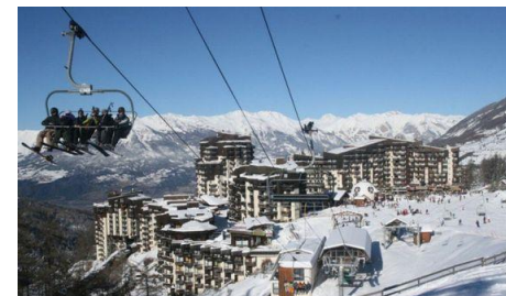
Les Orres (FR)